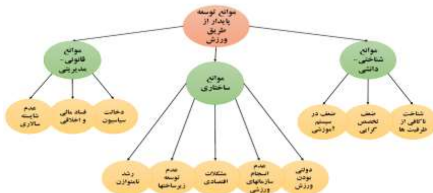
شکل ۱- الگوی موانع توسعه پایدار از طریق ورزش

پس از اتمام و تکمیل کدگذاری‌ها و دسته‌بندی کدها و شکل‌گیری مفاهیم و مقوله‌ها، الگوی موانع توسعه پایدار از طریق ورزش، به‌صورت شکل شماره یک تدوین شد که در برگزیده سه مفهوم اصلی و ۱۱ مقوله فرعی است.