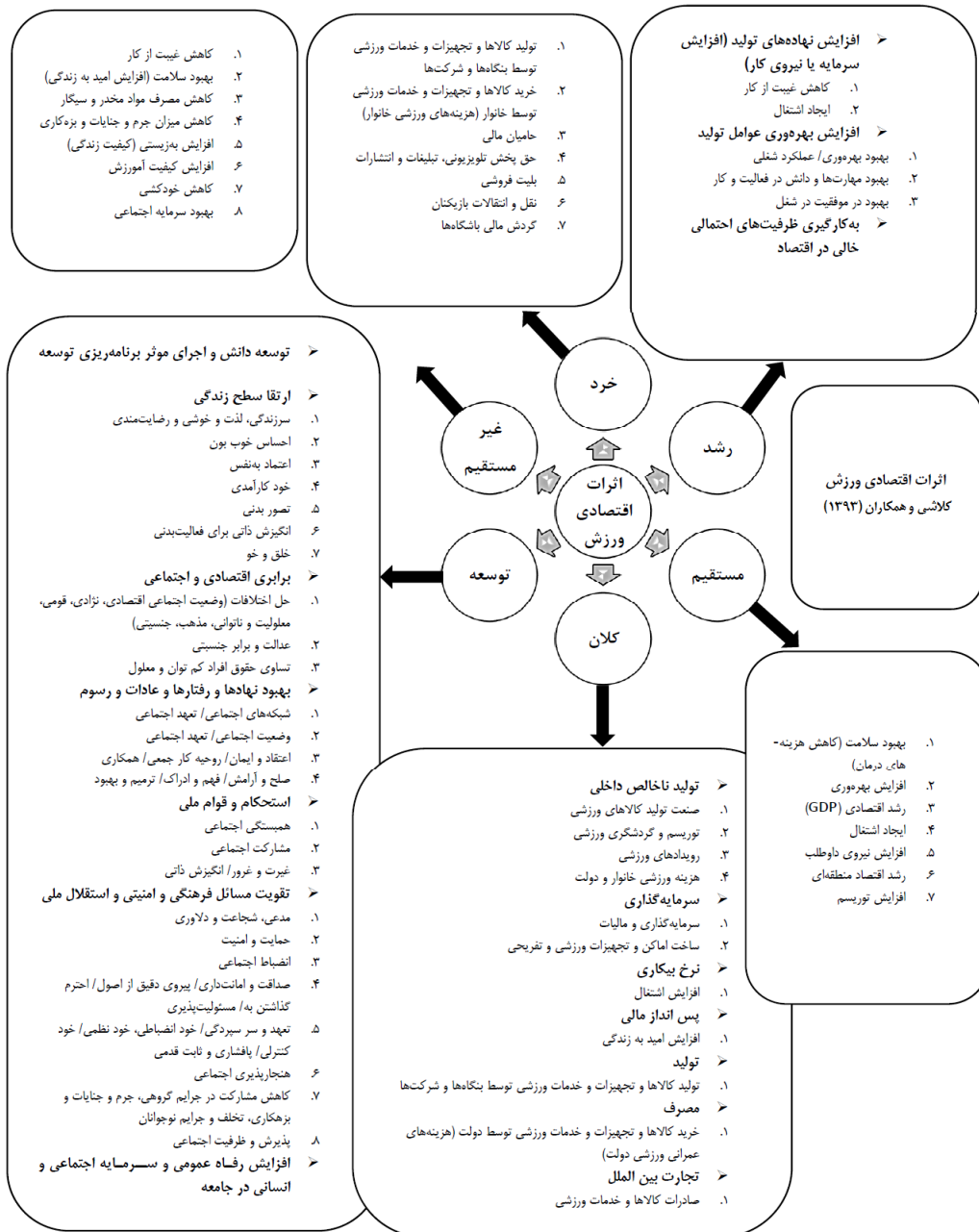
شکل ۱- اثرات اقتصادی ورزش