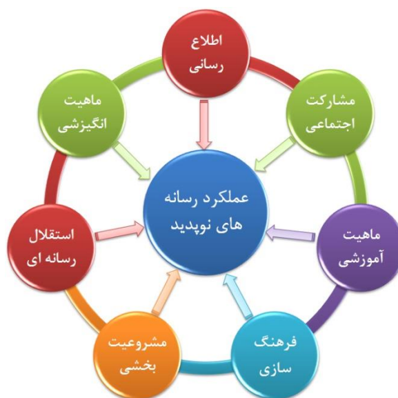
شکل ۳- مدل مفهومی پژوهش