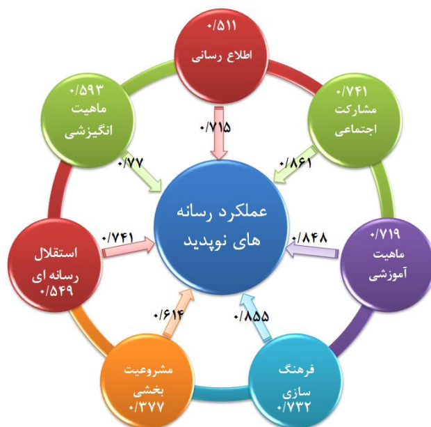
شکل ۲- سنجش بارهای عاملی مدل پژوهش