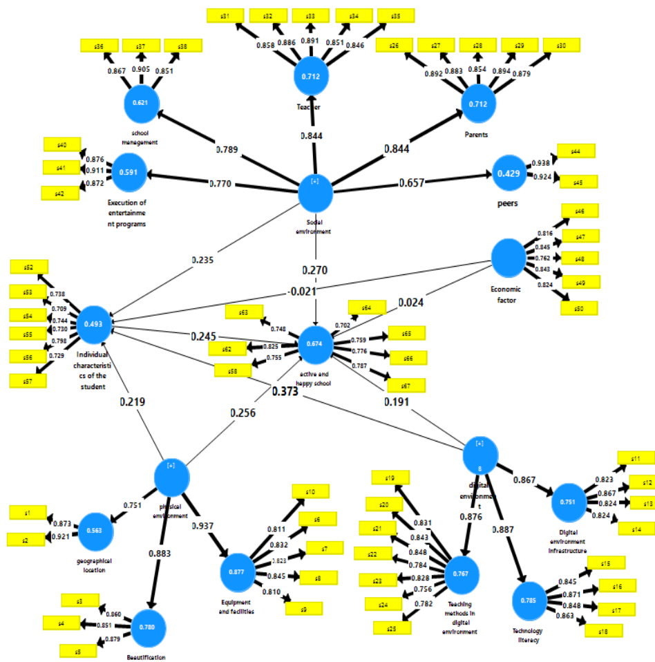
شکل ۲- ضرایب استاندارد مدل پژوهش