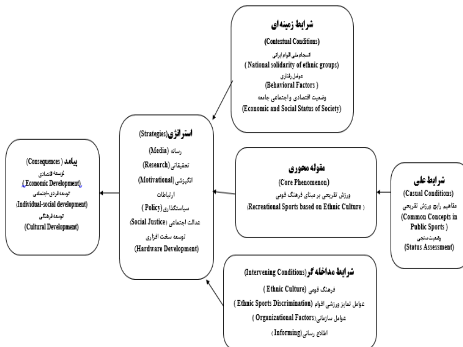
شکل ۲- الگوی جامع توسعه ورزش تفریحی بر مبنای فرهنگ قومی