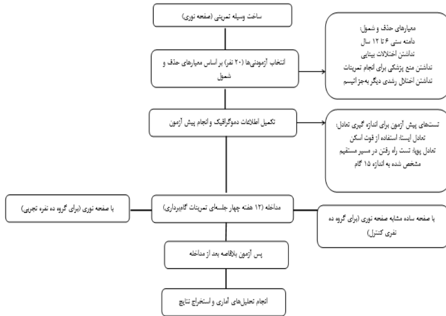
شکل ۳- فلوجارت پژوهش