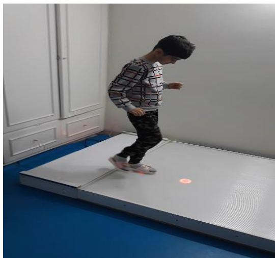
شکل ۱- صفحه نوری گام‌برداری

اندازه‌گیری تعادل پویا: به منظور اندازه‌گیری تعادل پویا، از آزمون راه رفتن پاشنه به پنجه استفاده شد. نحوه اجرای آزمون به این صورت بود که آزمودنی در یک خط مستقیم مشخ شده به طول ۱۵ گام، به صورت پاشنه به پنجه راه می‌رفت. بیشترین نمره آزمون ۱۵ بود. چنانچه آزمودنی قبل از کامل کردن ۱۵ گام منحرف می‌شد، آزمون متوقف شده و تعداد گام‌ها به عنوان رکورد ثبت می‌شد (۳۰، ۱۹). این آزمون سه بار اجرا شد و بهترین نمره به عنوان رکورد مرحله پیش‌آزمون برای آزمودنی ثبت شد. همه این مراحل برای ارزیابی تعادل پویای آزمودنی‌ها در پس‌آزمون تکرار شد. صفحه نوری گام‌برداری: ابزار این پژوهش صفحه نوری گام‌برداری، با نام کامل دستگاه یکپارچه سازی حسی-حرکتی برای توان‌بخشی اختلالات گام‌برداری است که در ایران دارای ثبت اختراع با کد بین‌المللی A45B 21/00 است. صفحه نوری یک ماتریس نوری مستطیل شکل با ابعاد 240 \times 120 سانتی‌متر بود که به 32 مربع 30 \times 30 سانتی‌متری تقسیم شده بود. این وسیله امکان انجام الگوهای مختلف گام‌برداری روی یک چهارچوب جدولی شکل نوری در جهات چندانگانه را براساس توانایی و شیب پیشرفت آزمودنی فراهم می‌کرد. با توجه به شکل ظاهری و کاربری وسیله، برای اسم وسیله، عنوان «صفحه نوری گام‌برداری» انتخاب شد. هدف از ساخت صفحه نوری گام‌برداری، ارائه الگوهای مختلف گام‌برداری متناسب با شرایط و ویژگی‌های کودکان مبتلا به ایتسم بود. در طراحی الگوهای گام‌برداری، اصول علم تمرین براساس متغیرهای مؤثر بر سختی گام‌برداری و خصوصیات افراد مبتلا به ایتسم در نظر گرفته شد.