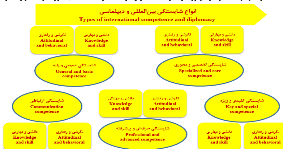
شکل ۴ - سطح سوم مدل: فرایند توسعه شایستگی‌های بین‌المللی و دیپلماسی مدیران ورزشی Figure 4. The third level of the model: the process of developing international competencies and diplomacy of sports managers

مطابق کدگذاری ماتریسی انجام شده، می‌توان گفت که توسعه شایستگی بین‌المللی و دیپلماسی مدیران ورزشی، تنها از منظر ساختاری و سازمانی میسر نیست، بلکه تمامی مراحل و فرایندهای زمینه‌یابی و نیازسنجی، ظرفیت‌سازی و بسترسازی، سیاست‌گذاری و برنامه‌ریزی، توانمندسازی توسعه باید به طور همزمان حاصل تطبیق برنامه مسیر شغلی مدیران با برنامه‌های سازمانی در زمینه توانمندسازی مدیران باشد. به طور مثال تنها دوره‌های آموزشی برای ارتقای جنبه‌های دانش شایستگی در این مدیران، کافی نیست و خود مدیران بایستی یادگیری و خودآموزی داشته باشند. پور افکاری و قنبری (۱۳۹۱) و ویلج ۱ ، (۲۰۱۵) سازوکار توانمندسازی در مدیریت سازمان‌های ورزشی را اثربخش گزارش کرده‌اند. لارا و سالاس والینا ۲ (۲۰۱۷) نیز توانمندسازی مدیران را یک فرایند نظام‌مند می‌دانند. بر مبنای این سطح مدل، پیشنهاد می‌شود که برای ارتقای شایستگی‌های بین‌المللی و دیپلماسی مدیران ورزشی تنها به اقدامات و برنامه‌های موردی، مانند دوره آموزشی و فرصت اجرایی برای مدیران اکتفا نشود، بلکه به صورت نظام‌مند و هدفمند فرایند نیازسنجی، ظرفیت‌سازی، برنامه‌ریزی، توانمندسازی و توسعه در هر دو رویکرد فردی (مدیران) و ساختاری (سیستم) مورد توجه قرار بگیرد.