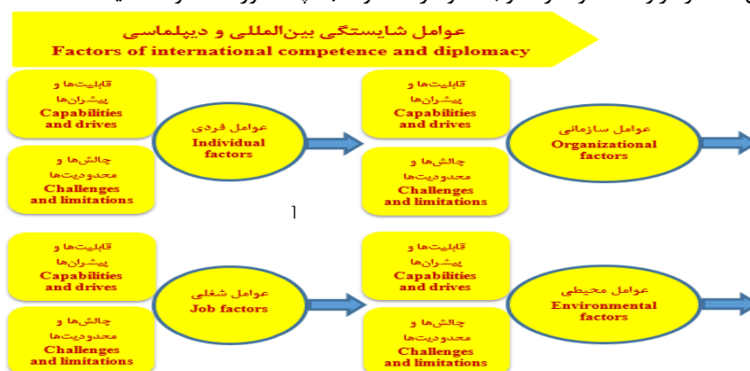
شکل ۲ - سطح اول مدل مفهومی تحقیق: عوامل شایستگی‌های بین‌المللی و دیپلماسی مدیران ورزشی

ارتباطی و شناختی گزارش کرده اند همسویی داشت. جانکوویچ ۱ (۲۰۱۴) پیوند ورزش بین‌الملل و ابعاد عمومی دیپلماسی را در محوریت توانایی مدیران می‌داند. مورای ۲ (۲۰۱۳) در مطالعه خود دیپلماسی ورزش را بیشتر حاصل توجه مدیران به محیط سیاسی داخل و ورزش بین‌المللی می‌داند. یک نگاه سنتی رایج در عرف مدیریتی ایران و ادبیات نخبگان سیاسی، این است که ورزش را باید به اهل آن واگذاری کرد، البته منظور از اهل آن در فهم عامه، ورزشکاران نخبه و افتخارآفرینان ملی است. آشنایی و تخصص در یک یا چند رشته ورزشی، شرط لازم برای تصدی مدیریت ورزش کشور است، اما به هیچ‌رو شرط کافی نیست. باعنایت به کارکردهای متنوع ورزش و ارتقای نهاد ورزش به یک پدیده متکثر جهانی، ضروری است که شاخص‌ها و شایستگی‌های لازم و کافی برای تصدی پست‌های کلان مدیران ارشد ورزش کشور بررسی و مشخص شود. سازمان‌ها به مدیران و کارکنان اثربخش و کارآمد نیاز دارند تا بتوانند به اهداف خود در جهت رشد و توسعه همه‌جانبه دست یابند. مدیران به‌عنوان اصلی‌ترین افراد تصمیم‌گیرنده در مواجهه با مسائل و مشکلات سازمانی، نقش به‌سزا و تعیین‌کننده‌ای در موفقیت یا حتی شکست سازمان ایفا می‌کنند. از این رو پیشنهاد می‌شود که کارگزاران و دست‌اندرکاران در تصمیم‌گیری، برنامه‌ریزی، اجرا و ارزیابی خود برای تربیت و توانمندسازی مدیران ورزشی عوامل چالشی و قابلیت‌های مربوط به جنبه‌های فردی، شغلی، سازمانی و محیطی را به طور همزمان مدنظر قرار دهند و صرفاً توجه خود را معطوف به چند مورد محدود ننمایند.