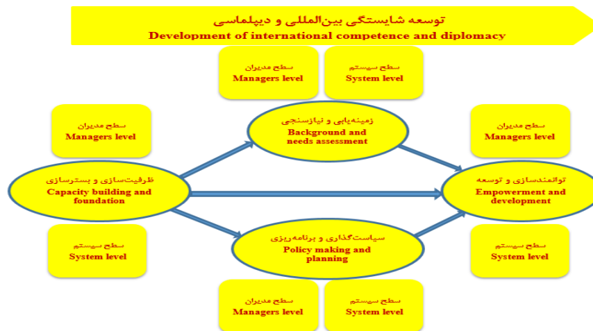
شکل ۳ - سطح دوم مدل: انواع شایستگی‌های بین‌المللی و دیپلماسی برای مدیران ورزشی Figure 3. Second level of the model: types of international competencies and diplomacy for sports managers

سطح سوم مدل: فرایند توسعه شایستگی‌های بین‌المللی و دیپلماسی مدیران ورزشی سطح سوم مدل مفهومی شامل فرایند توسعه شایستگی‌های بین‌المللی و دیپلماسی مدیران ورزشی مشتمل بر منظرهای زمینه‌یابی و نیازسنجی، ظرفیت‌سازی و بسترسازی، سیاست‌گذاری و برنامه‌ریزی، توانمندسازی و توسعه شایستگی به تفکیک ابعاد حوزه فردی (مدیران) و حوزه ساختاری (سیستم) بود. نتایج مدل‌سازی کمی در بخش تحلیل عاملی ابعاد و مولفه‌هایی مربوط به متغیرهای اصلی مدل نشان داد که: ابعاد سطح مدیران و سطح سیستم به ترتیب نقش معناداری در تبیین زمینه‌یابی و نیازسنجی داشتند. ابعاد سطح سیستم و سطح مدیران، به یک میزان دارای نقش معناداری در تبیین ظرفیت‌سازی و بسترسازی و همچنین در تبیین سیاست‌گذاری و برنامه‌ریزی داشتند. ابعاد سطح سیستم و سطح مدیران، به ترتیب دارای نقش معناداری در تبیین توانمندسازی و توسعه شایستگی بودند. با بررسی دستگاه‌های منابع انسانی سازمان‌ها مشخص می‌شود که در سیستم‌هایی مانند آموزش، ارزیابی عملکرد، جذب و غیره ارتباطات و پیوستگی لازم وجود ندارد و از همین‌رو بیشتر برنامه‌های مرتبط با منابع انسانی به ناکارآمدی سیستم‌های منابع انسانی منتهی می‌شود. به عبارت دیگر وجود ارتباطات و همپوشی‌های قوی، بین زیرسیستم‌های مختلف منابع انسانی به‌منظور تقویت متقابل هر یک از زیرسیستم‌ها، ضروری است و در نهایت نظام‌مند و پویا شدن سیستم منابع انسانی ضروری است که امروزه در کمتر سازمانی بدان توجه کافی مبذول می‌شود.