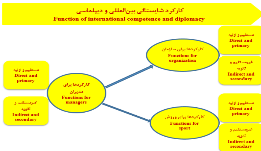
شکل ۵ - سطح چهارم مدل: کارکردهای شایستگی‌های بین‌المللی و دیپلماسی مدیران ورزشی Figure 5. Level 4 of the model: Functions of international competencies and diplomacy of sports managers

سطح چهارم مدل: کارکردهای شایستگی‌های بین‌المللی و دیپلماسی مدیران ورزشی آخرین سطح مدل مفهومی، شامل کارکردهای شایستگی‌های بین‌المللی و دیپلماسی مدیران ورزشی است که مشتمل بر منظرهای کارکرد برای مدیران، کارکرد برای سازمان‌ها و کارکرد برای ورزش و به تفکیک دو نوع ابعاد کارکردهای مستقیم-اولیه و کارکردهای غیرمستقیم - ثانویه است. نتایج مدل-سازگی کمی در بخش تحلیل عاملی ابعاد و مولفه‌هایی مربوط به متغیرهای اصلی مدل، نشان داد که ابعاد کارکردهای مستقیم و اولیه و کارکردهای غیرمستقیم و ثانویه به ترتیب نقش معناداری در تبیین کارکردها برای مدیران، سازمان و ورزش داشتند.