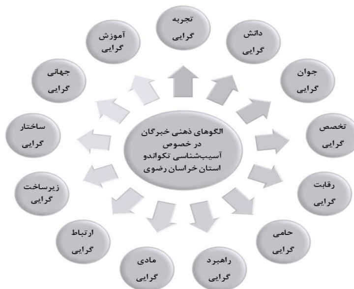
شکل ۳ - الگوهای ذهنی شناسایی شده