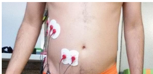
شکل ۱- نحوه‌ی الکتروگذارای عضلات

داده‌ها با فرکانس ۱۰۰۰ هرتز بوسیله سیستم الکترومیوگرافی سطحی ثبت شد. آزمون در هفت ثانیه انجام شد و پنج ثانیه کامل از داده‌های الکترومیوگرافی مورد تجزیه و تحلیل قرار گرفت. داده‌ها بوسیله ریشه دوم میانگین ۱ (سطح زیر نمودار) و در پنجره‌های ۵۰ میلی ثانیه‌ای یکنواخت شد. برای انجام پروتکل از یک دستگاه سوئیچ کف‌پایی استفاده شد. این وسیله به دستگاه الکترومیوگرافی متصل و برای تعیین زمان تماس اولیه با زمین استفاده شد. در شروع هر کوشش، هنگامیکه آزمودنی در وضعیت آزمون قرار می‌گرفت به مدت سه ثانیه و هنگامیکه هیچ فعالیت عضلانی قابل تشخیص وجود نداشت، فعالیت عضلات ثبت و به عنوان خط مبنا در نظر گرفته شد. برای هر آزمودنی دو کوشش از سه کوشش با حداقل اختلاف در فعال شدن عضلات برای گرفتن میانگین و آنالیز داده‌ها مورد استفاده قرار گرفت. در بررسی داده‌های الکترومیوگرافی، برای نرمال کردن داده‌ها از حداکثر انقباض ارادی ۲ استفاده شد. هر وضعیت دو بار و به مدت سه ثانیه تکرار و سپس میانگین داده‌ها مورد بررسی قرار گرفت. برای بررسی میزان فعالیت از سطح زیر نمودار موج کامل ۳ استفاده شد (۳۰، ۳۲).