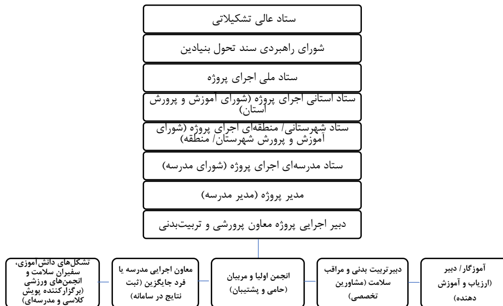
شکل ۱- نمودار تشکیلاتی طرح ملی کنترل وزن و چاقی دانش‌آموزان

سالم، به اجرای این طرح در سه مرحله «درون‌دادی، فرایندی و برون‌دادی» اقدام شود (برنامه عملیاتی طرح کوچ، ۲۰۲۰، ۳). این پروژه با هدف کلی افزایش دانش و بهبود نگرش دانش‌آموزان و خانواده‌های آن‌ها در خصوص ورزش و فعالیت‌بدنی و نیز کمک به دانش‌آموزان در مدیریت وزن خویش و داشتن سبک زندگی سالم و فعال در طول سال تحصیلی ۱۴۰۰-۱۳۹۹ اجرا شد و یکی از مهم‌ترین اهداف اختصاصی آن کاهش ۳ درصدی تعداد دانش‌آموزان چاق و دارای اضافه‌وزن می‌باشد که برای تحقق این هدف ساختار تشکیلاتی عوامل اجرایی دخیل در طرح فوق در سطوح ستادی، استانی، منطقه‌ای و مدرسه‌ای به شرح شکل ۱ پیش‌بینی شد: