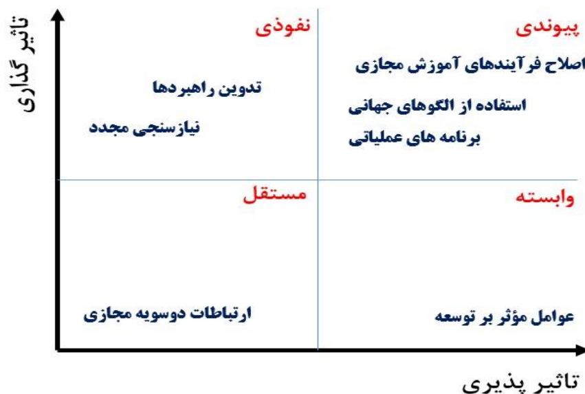
شکل ۲- نتیجه تحلیل میک‌مک

شکل ۲، نتیجه میزان وابستگی و قدرت نفوذ را برای هر یک از شاخص‌ها نشان می‌دهد. بر این اساس شاخص‌های نیازسنجی مجدد، تدوین راهبردها در منطقه نفوذی، شاخص ارتباطات دو سویه مجازی در منطقه خودمختار (مستقل) و شاخص عوامل مؤثر بر توسعه در منطقه وابسته و شاخص‌های اصلاح فرآیندهای آموزش مجازی، برنامه‌های عملیاتی و استفاده از الگوهای جهانی در منطقه پیوندی هستند. عوامل خودمختار شامل عواملی هستند که دارای قدرت نفوذ و وابستگی