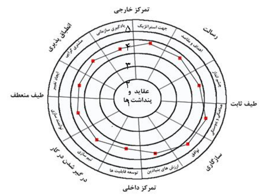
شکل ۳. شمای کلی فرهنگ سازمانی در اداره کل ورزش و جوانان استان آذربایجان غربی

نگاهی به این نمودار نشان می دهد که اداره کل ورزش و جوانان استان آذربایجان غربی به لحاظ فرهنگ سازمانی، در ابعاد سازگاری و مأموریت وضعیت قابل قبولی دارد و در ابعاد انطباق پذیری و به خصوص درگیر شدن در کار نیازمند توجه و برنامه ریزی در جهت بهبود است. نمودار ۳ فرهنگ سازمانی منطبق با دیاگرام مدل دنیسون هم چنین نشان می دهد که فرهنگ سازمانی در اداره کل مورد بررسی از جهت تمرکز داخلی و خارجی تقریباً وضعیت مشابهی دارد و از حیث میزان انعطاف پذیری، بیشتر ثابت و غیر منعطف است.