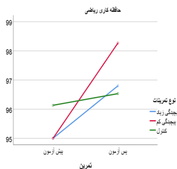
شکل ۳- حافظه کاری فضایی