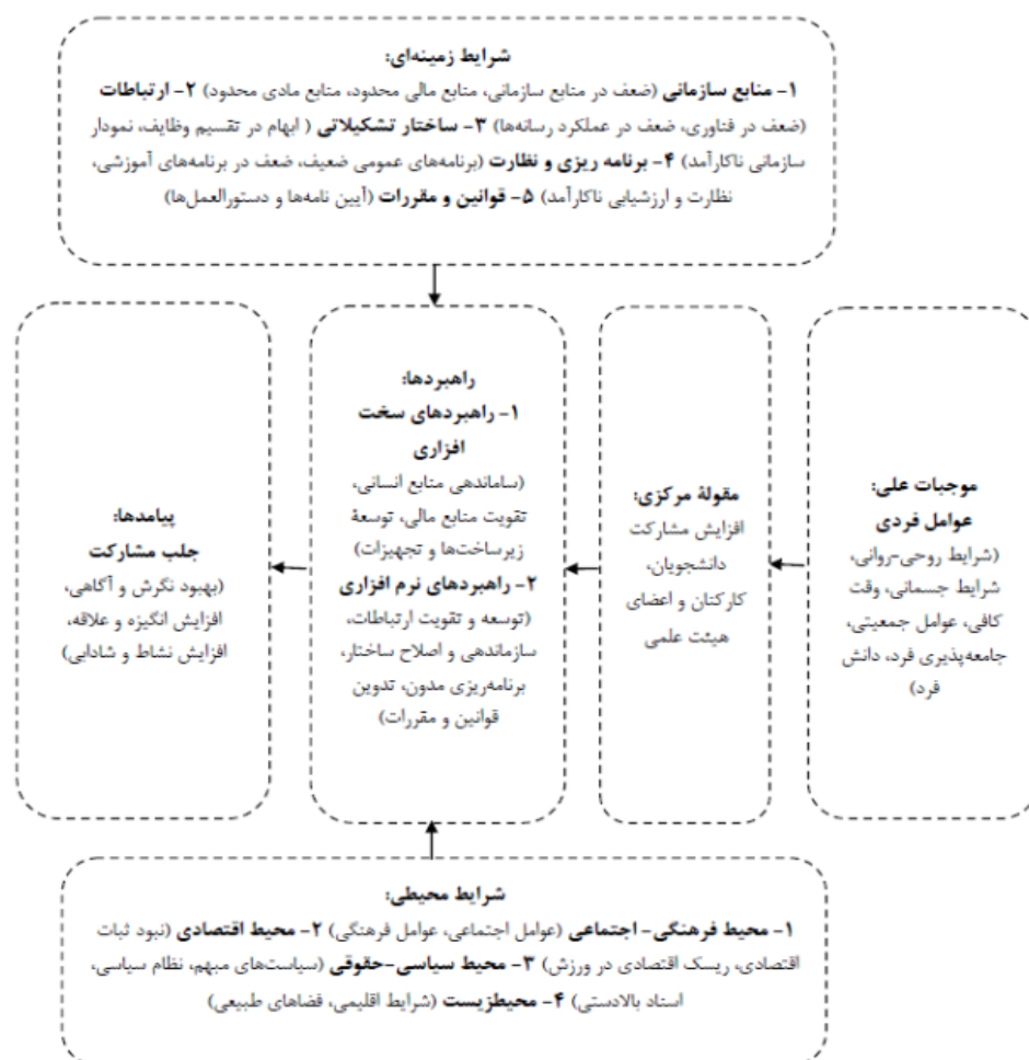
شکل ۲- مدل مفهومی توسعه ورزش همگانی دانشگاه آزاد اسلامی

طبق مدل مفهومی پژوهش حاضر که برگرفته از بیشترین نظرهای اعضای هیئت علمی دانشگاه آزاد اسلامی است، روابط ابعاد ورزش همگانی دانشگاه آزاد اسلامی و نحوه اثرگذاری این شاخص‌ها بر توسعه ورزش به بهترین نحو معرفی شده است. شرایط مداخله‌گر و زمینه‌ای در مدل، منطبق بر تهدیدها، فرصت‌ها، قوت‌ها و ضعف‌های وضعیت موجود دانشگاه آزاد اسلامی است که تاکنون در هیچ پژوهش دیگری به آن‌ها پرداخته نشده است. به نظر می‌رسد بتوان با آگاهی از این روابط و شرایط خاص درحال حاضر دانشگاه آزاد اسلامی (تغییرات پی‌درپی در نمودار سازمانی، تغییرات مدیریتی مکرر، وضعیت اقتصادی کشور، افزایش شهریه تحصیلی و ...) این امکان را برای اداره کل