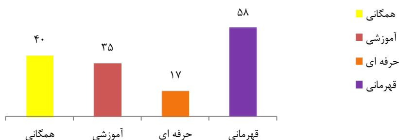
شکل ۱- نمودار ستونی توزیع فراوانی نمونه‌ها براساس میزان اثرهای واگذاری اماکن ورزشی بر ابعاد مختلف ورزش

بخش خصوصی قرار می گیرد، تنها به دنبال کسب درآمد بیشتر می باشند. به همین خاطر، افزایش یا کاهش ورزشکاران جامعه هدف برای بخش خصوصی فرقی ندارد.