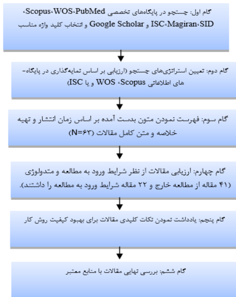
شکل ۱- دیاگرام مربوط به نحوه بررسی کیفیت مقالات

تمرینات ورزشی، بريس زانو، توان‌بخشی، کنزیوتیپ، سالمندان، تمرینات اصلاحی، ارتز و درد استفاده شد. ۶۳ مقاله مرتبط براساس معیارهای ورود و خروج انتخاب شد. معیارهای ورود مقالات به مطالعه عبارت بودند از: ۱- مقالات در حوزه به‌کارگیری انواع پروتکل تمرینی و ابزارهای حمایتی در افراد دارای عارضه استئوآرتریت زانو باشد؛ ۲- مقالاتی که آزمودنی‌ها تنها به عارضه استئوآرتریت زانو مبتلا بودند؛ ۳- مقالاتی که از سالمندان به‌عنوان آزمودنی استفاده کرده بودند. مقالاتی که آزمودنی‌ها مبتلا به سایر ناهنجاری‌های بدن بودند یا سابقه عمل جراحی (توان‌بخشی پس از جراحی) در مفصل زانو داشتند، از مطالعه خارج شدند. درنهایت، ۲۲ مقاله درباره تأثیر انواع پروتکل تمرینی و ابزارهای حمایتی بر عارضه استئوآرتریت زانو بررسی و تحلیل شد. مقالاتی که فایل کامل آن‌ها در دسترس نبود، از طریق سایت (ISI) link خریداری شد. اعتبارسنجی مقالات از طریق سنجش و ارزیابی مقالاتی که در پایگاه‌های WOS, Scopus, و ISC نمایه شده بودند، ارزیابی شد. مقالات بررسی شده باید حداقل در یکی از این سه پایگاه استنادی نمایه شده بود (شکل شماره یک). شکل شماره دو روند انتخاب مقالات مطالعه مروری حاضر را نشان می‌دهد.